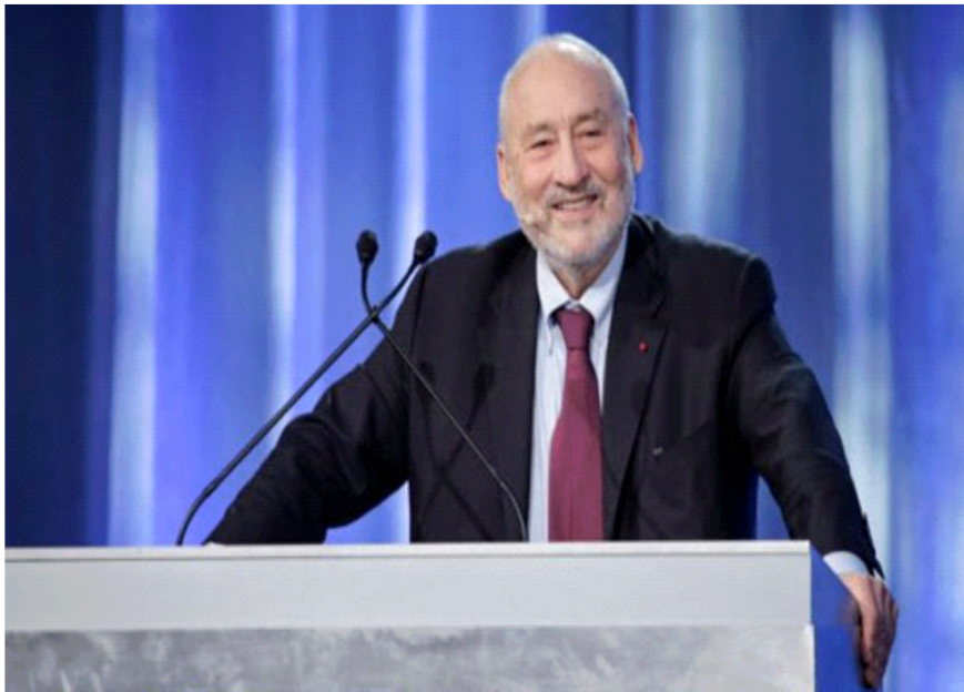
Joseph Stiglitz - Premio Nobel de Economía

"As cooperativas xogarán un papel moi importante na próxima década, como a única alternativa ao modelo económico fundado no egoísmo que fomenta as desigualdades".